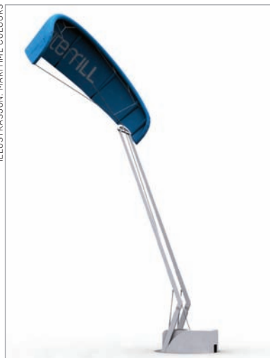
ILLUSTRASJON: MARITIME COLOURS

KiteMill er et prosjekt som jobber for å redusere kostnaden ved produksjon av elektrisk kraft fra vind ved bruk av en kite eller flygende vinge. En kite er en drage eller vinge som kan fly i vinden. Vingene har de senere årene utviklet seg voldsomt. Det er i dag mulig å benytte slike vinger for å redusere drivstoffbruket på store skip. I fremtiden vil vi trolig se store vind-parker med flygende vinger i stedet for dagens vindmøller.