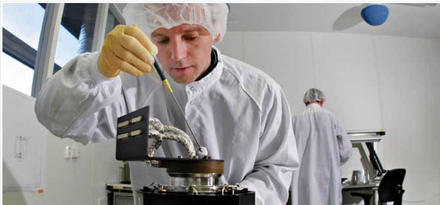
Kongsberg er et effektivt sted for å drive produkt- og systemutvikling.